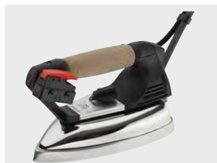
Паровой утюг EOS PRO (включён в базовую комплектацию)