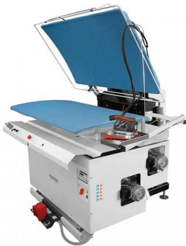
ПРЯМОУГОЛЬНАЯ ГЛАДИЛЬНАЯ ФОРМА

Пневматический гладильный пресс для прачечной и химчистки