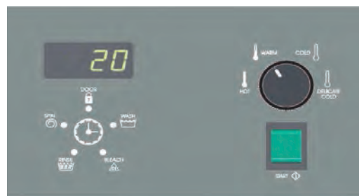
Galaxy 200 (G200)

Клиенты выбирают продукцию Huebsch из-за простоты в эксплуатации, высокой надёжности, беспрецедентно длительного срока эксплуатации и энергоэффективности.