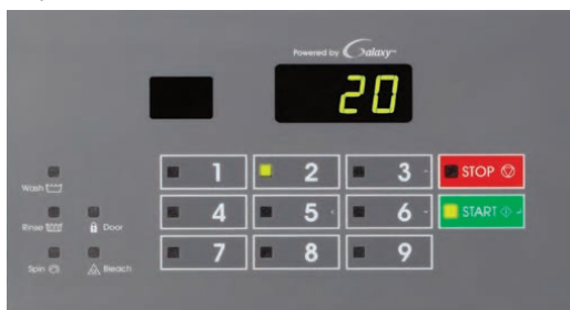
Galaxy 400 (G400)

eBoost – это революционная система отжима, которая предлагает высокую эффективность. Благодаря продвинутой технологии инверторного двигателя, усовершенствованного дизайна барабана и сливного насоса, сократился расход электроэнергии на 33% и расход воды на 11%. Недрессоренные стиральные машины поставляются в комплектации с двумя системами управления - Galaxy 400 и Galaxy 200. Наиболее продвинутая система Galaxy 400 даёт возможность программирования индивидуальных программ стирки через инфракрасный порт, предлагает более высокую скорость отжима, позволяет выбрать дополнительный уровень водного модуля.